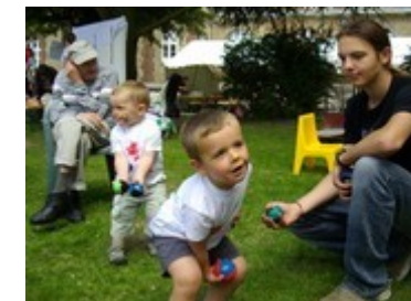
Piste Sur Scène associe les seniors et les tout petits