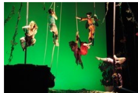
Le Cirque Amateur en Piste

Les spectacles peuvent être accompagnés de Workshop : Clown et bruitages